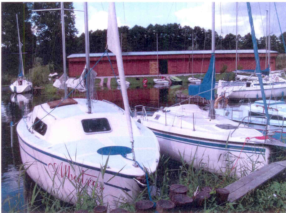
Zdjęcie 2: Harcerska baza żeglarska „Phanta Rei”, nad jez. Osiek

Wodniacy współpracują z niemieckim klubem żeglarskim w Strausbergu. Na terenie bazy zachowany jest dość surowy klimat, który pozwala na obcowanie z naturą. Przystań jest terenem ogrodzonym z wydzielonym parkingiem i polem namiotowym oraz własnym zapleczem sprzętu pływającego.