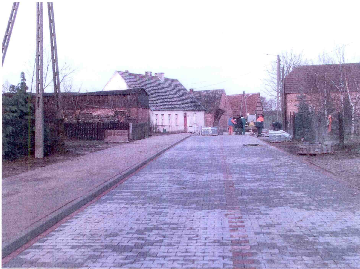
Zdjęcie 4: Remont drogi wewnętrznej w miejscowości Osiek – 2010 r.

Wewnętrzna droga dojazdowa została przebudowana na odcinku 530 m, wymieniono nawierzchnię oraz wykonano chodniki i odwodnienie korpusu drogi.