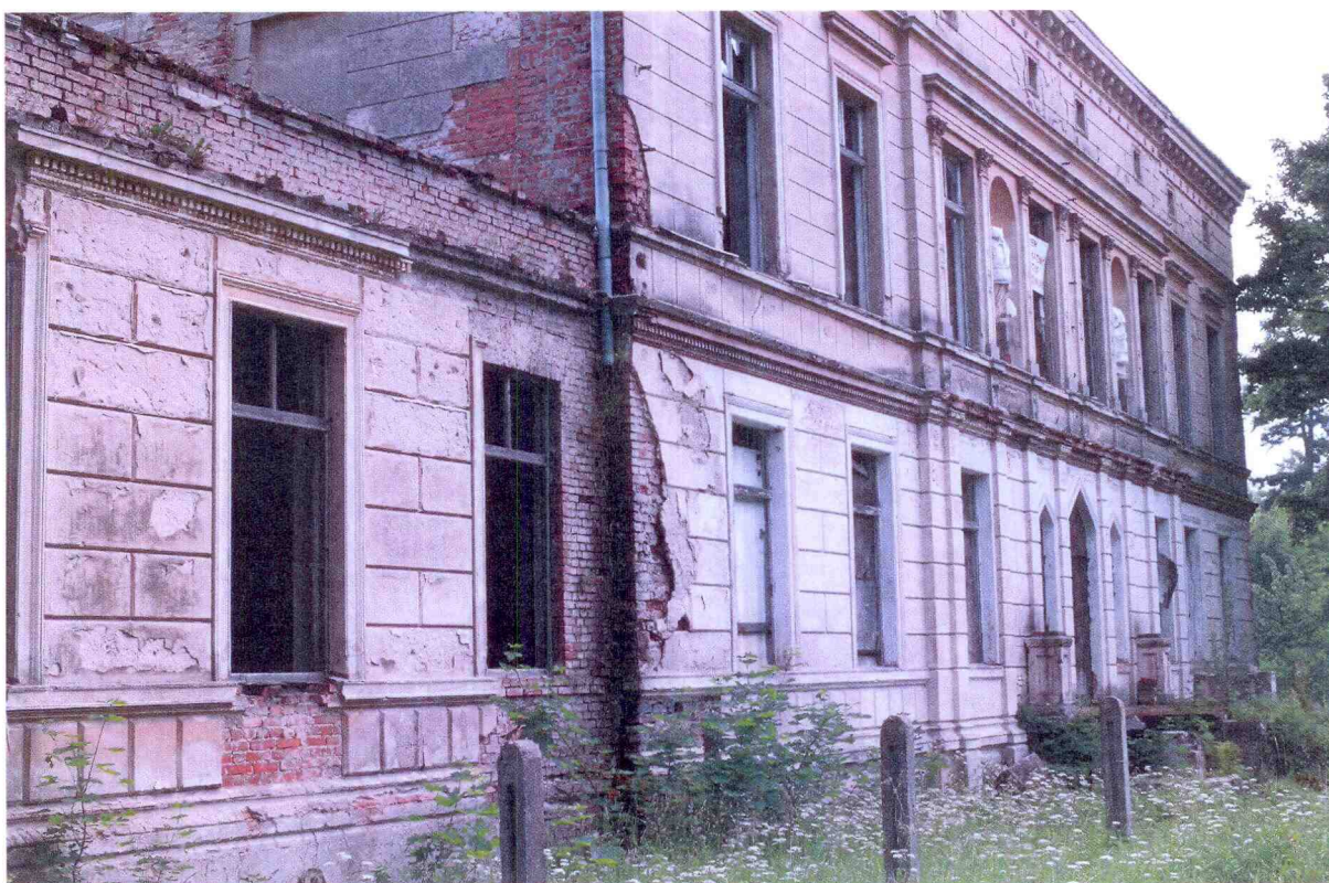
Zdjęcie 3: zabytkowy pałac w Osieku, widok od strony miejscowości

ryzalitem. Układ pomieszczeń w parterze jest klasycystyczny z osią centralną, mieszczącą po wschodniej stronie sień z klatką schodową oraz salą ogrodową z ozdobnym wyjściem na założenie parkowe. Po obu stronach sieni znajdują się pomieszczenia boczne. Wystrój i wyposażenie wnętrza nie zachował się do dnia dzisiejszego. Wyjątek stanowią kominki o bogatym wystroju sztukatorskim z przedstawieniami heraldycznymi, znajdujące się w pomieszczeniach parteru i piętra. Ponadto, fragmentarycznie zachowały się XIX-wieczne dekoracje sztukatorskie sufitów. W okresie powojennym, zwłaszcza w latach 60. XX wieku przystąpiono do generalnego remontu pałacu z intencją przystosowania budynku do celów ośrodka wczasowego. Wykonano w tym czasie m.in. cementowe wylewki, schody oraz częściowo zmieniono układ pomieszczeń. Prace zostały jednak zaniechane i nieremontowany oraz niedostatecznie zabezpieczony obiekt popada od tego czasu w ruinę. Prywatni właściciele budynku, od 1994 roku, pomimo składanych deklaracji nie prowadzą szerzej zakrojonych robót budowlanych, ograniczając się jedynie do niewielkich prac zabezpieczających.