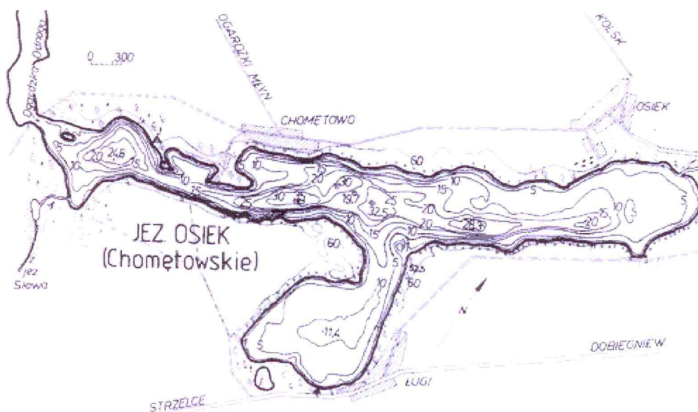
Rysunek 1: położenie jeziora Osiek wraz izoliniami głębokości

Jeziro Osiek (zwane też Chomętowskim) położone jest na Pojezierzu Dobiegniewskim - niedużym mezoregionie obejmującym wyspę morenową między sandrami Równiny Gorzowskiej i Drawskiej. Misę jeziorną jeziora Osiek tworzą trzy płosa: na zachodzie Ogardzka Odnoga, na południu tzw. jezioro Żabie lub Ługi i zasadnicza część jeziora rozciągająca się w kierunku północno-wschodnim. Do jeziora wpływa rzeka Ogardna, która wypływając przyjmuje nazwę Mierzęckiej Strugi. Ponadto jezioro zasilane jest dopływem z jeziora Słowa. Jezioro Osiek jest zbiornikiem o urozmaiconej budowie i znacznej głębokości. W otoczeniu akwenu dominują pola uprawne oddzielone od wody miejscami szerokim pasem drzew na stromych zboczach przyjeziornych. Zachodnią część głównego basenu, jak również Ogardzką Odnogę otaczają lasy. Dostęp do jeziora utrudniają strome brzegi. Niewiele małych miejsc kąpielowych znajduje się na brzegu północnym. Jezioro Osiek posiada bujną roślinność wodną, występującą głównie w licznych zatokach. W środkowej części jeziora występowanie roślinności ogranicza szybko opadające, lecz urozmaicone dno.