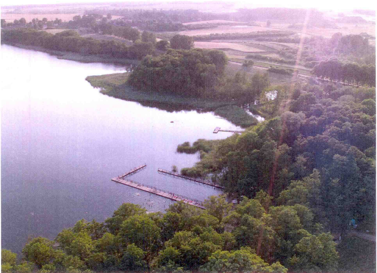
zdjęcie 1: Plaża nad jez. Osiek zdjęcie lotnicze – archiwum UM Dobiegniew

Zasoby sołectwa to wszelkie elementy materialne i niematerialne wsi oraz otaczającego ją obszaru, które mogą być wykorzystane obecnie bądź w przyszłości przy budowaniu czy realizacji publicznych i prywatnych przedsięwzięć odnowy wsi. Przy analizie zasobów wzięto pod uwagę następujące ich kategorie: środowisko przyrodnicze, środowisko kulturowe, dziedzictwo religijne i historyczne, obiekty, tereny, infrastruktura, gospodarka i rolnictwo, sąsiedzi i przyjezdni, instytucje, ludzie, organizacje społeczne.